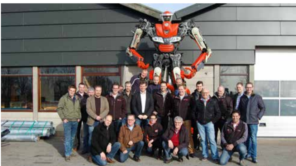
De Kioti dealerorganisaties treffen elkaar voor trainingen product introducties. Dit keer met de Kioti Transformer, samengesteld uit trekker onderdelen.

De laatste modellen zijn daar een schoolvoorbeeld van, of het nu gaat om de Kioti CK, NX, RX, PX- serie of de specialistische DK-serie, uw wens wordt vervuld.