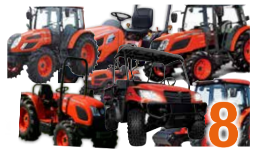
KIOTI NX20 SERIE GEAVANCEERDE TECHNOLOGIE